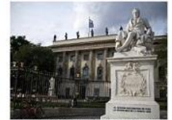
Universidad de Berlín (hoy, Humboldt Universität)

El final del siglo XIX es un momento de apogeo científico , especialmente en Alemania . La fisiología era una de disciplinas donde los descubrimientos se sucedían con éxito. A partir de ella, W. Wundt había fundado la Psicología Experimental en Leipzig.