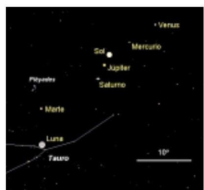
REPRESENTACIÓN DE LA CONJUNCIÓN DEL 5 DE MAYO, QUE SE PRODUCIRÁ ALREDEDOR DEL SOL, POR LO QUE SERÁ INOBSERVABLE.