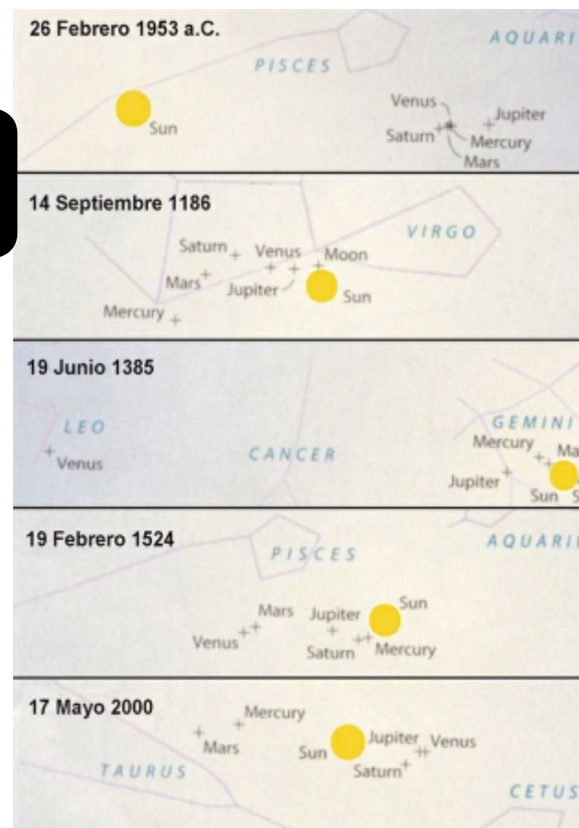
POSICIÓN RELATIVA DE LOS PLANETAS DEL SISTEMA SOLAR EL 5 DE MAYO DE 2000. NÓTESE QUE LA AGRUPACIÓN SE PRODUCE AL LADO OPUESTO DEL SOL, EN RELACIÓN CON LA TIERRA. VARIAS DE LAS CONJUNCIÓNES PLANETARIAS MÁS FAMOSAS EN LA HISTORIA DE LA HUMANIDAD, MÁS LA QUE SE ESPERA PARA MAYO DE ESTE AÑO. LA POSICIÓN DE LOS PLANETAS SE MUESTRA EN RELACIÓN CON LAS CONSTELACIONES. EL TROZO DE CIELO REPRESENTADO EN CADA CASO TIENE EL MISMO TAMAÑO PARA UNA MEJOR COMPARACIÓN.

ca se han cumplido y nada indica que esta vez vaya a suceder. Quizás la causa del revuelo sea que se trata de la primera conjunción en el mítico año 2000, una consecuencia más del "milenarismo" e irracionalidad que envuelven a los círculos esotéricos y new age . En realidad, los únicos efectos relevantes de esta disposición planetaria serían la pura atracción gravitatoria y el efecto marea sobre la Tierra y el Sol. La fuerza de la gravedad consiste en la atracción o "tirón" mutuo entre objetos masivos, y explica físicamente, por ejemplo, que una manzana desprendida de un árbol tienda a caer en dirección al centro de la Tierra atraída por ésta. Así también nuestro peso en una balanza indica la fuerza con que nuestro planeta "tira" de nosotros; la Luna gira