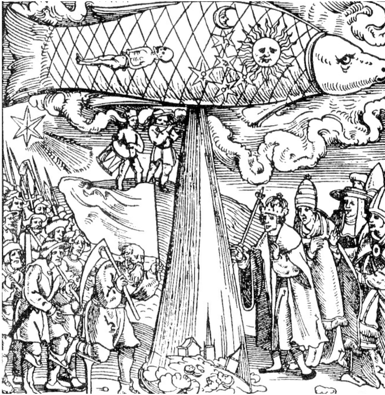
IMAGEN DEL SIGLO XVI DE LEONHARD REYMANN QUE MUESTRA LA CONEXIÓN IMAGINADA ENTRE LA CONJUNCIÓN DE FEBRERO DE 1524 Y UN DILUVIO UNIVERSAL.

No podemos olvidar que los cálculos que sirven para enviar una nave al espacio o mantener girando a los satélites artificiales de meteorología o comunicaciones en torno a la Tierra se basan en los mismos principios físicos que explican las mareas, el movimiento alrededor del Sol de los planetas, el retorno de algunos cometas o las conjunciones y eclipses y sus posibles efectos. ¿Por qué algunas personas dan crédito a magos y videntes que —despreciando sin rubor las conclusiones y predicciones científicas— se atreven a profetizar toda suerte de cataclismos que nunca han ocurrido, mientras, por otra parte, jamás dudan de la validez de la Física cuando, en su vida normal, consultan la prensa para conocer la hora y altura de la pleamar, encienden la tele o utilizan el teléfono móvil y confían en que les llegue puntualmente la señal vía satélite...? Vale la pena dedicar un pensamiento a tamaña contradicción.