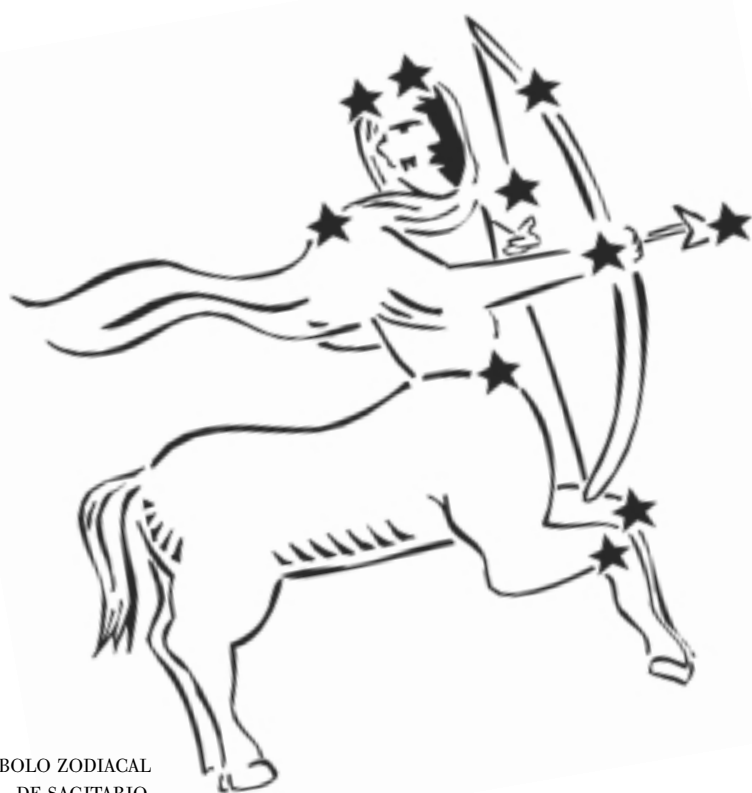
SÍMBOLO ZODIACAL DE SAGITARIO.

EN UNA SOCIEDAD COMO LA ACTUAL, DONDE LA CIENCIA ALARGA NUESTRAS VIDAS Y NOS PERMITE CONOCER LAS ZONAS MÁS RECÓNDITAS DEL UNIVERSO, RESULTA PARADÓJICO QUE UNA BUENA PARTE DE LA POBLACIÓN SE PREOCUPE EN BUSCAR SU FUTURO DIARIO EN LA COLUMNA DEL HORÓSCOPO O LLAMANDO POR TELÉFONO AL ASTRÓLOGO TELEVISIVO DE MODA. PERO NO NOS ENGAÑEMOS, LA ASTROLOGÍA NO SE BASA EN NINGÚN PRINCIPIO CIENTÍFICO, ES UNA PURA FALACIA.