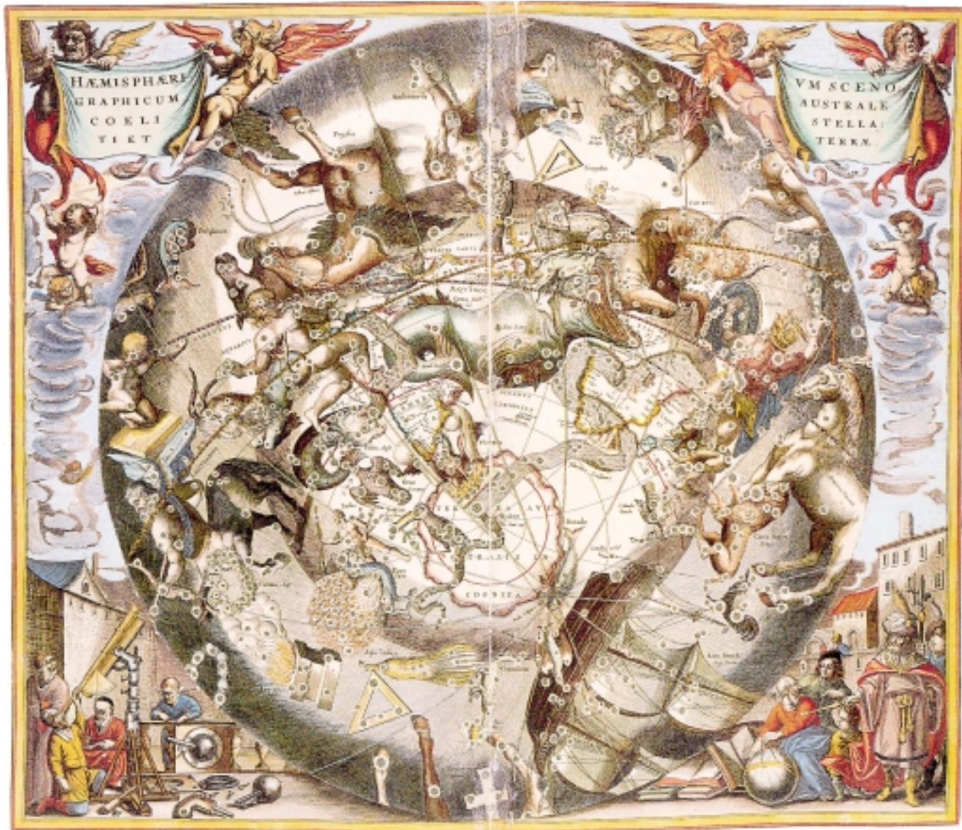
MAPA DEL CIELO AUSTRAL REALIZADA POR ANDREAS CELLANIUS EN 1660.

ciudad se viste de turistas, como Egipto. Somos la ruta de los dos mundos, el mesón de todos los caminos. ●●●